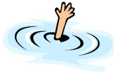
I can't swim