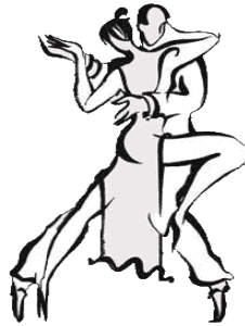
“They can dance tango”

3.- Su forma negativa es “cannot” ( una sola palabra) o “can’t”