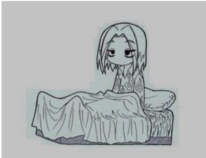
“ The girl cannot sleep”

3.- Su forma negativa es “cannot” ( una sola palabra) o “can’t”