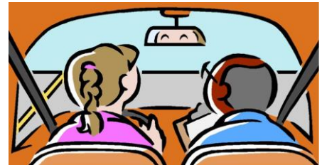
Can the girl drive cars?