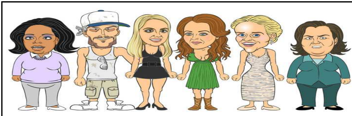
Oprah, K-Fed, Britney, Lindsay, Reese, Rosie